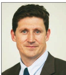
Éamonn Ó Riain T.D. Aire Cumarsáide, Fuinnimh agus Acmhainní Nádúrtha

Léiríonn an Ráiteas Straitéise seo an clár oibre leathan agus dúshlánach atá ann do mo Roinn thar na trí bhliana atá le teacht. Forbraíodh é i ndiaidh próiseas comhairliúcháin, go raibh níos mó ná 60 aighneacht mar thoradh air agus iad ag baint le gach sainchúram de chuid na Roinne. Déanann an Ráiteas cinnte go bhfuil misean agus straitéisí na Roinne leagtha amach go soiléir agus socraíonn sé na príomhspricanna agus táscairí feidhmíochta ar a dhéanfar tomhas ar an méid atá bainte amach againn thar an tréimhse 2008 – 2010.