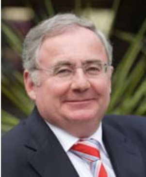
Pat Rabbitte, T.D.