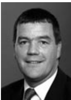
Noel Dempsey, T.D. Aire Cumarsáide, Mara agus Acmhainní Nádúrtha

Léiríonn an Ráiteas Straitéise seo tosaíochtaí an Rialtais mar atá leagtha amach sa Chlár Comhaontaithe don Rialtas agus an comhchlár oibre atá leagtha amach sa Chomhaontú Comhpháirtíochta Sóisialta Ag Coinneáil an Dul Chun Cinn . Leagann sé síos clár dúshlánach do mo Roinnse thar an tréimhse go dtí an bhliain 2007. Is é seo bunchloch de phróiseas pleanála gnó na Roinne agus leagann sé amach na spriocanna agus na cuspóirí for-iomlána agus na príomhghníomhartha atá molta lena mbaint amach. Gníomhaíonn sé chomh maith mar an pointe tagartha chun dul chun cinn a mheas ó thaobh bhaint amach na n-aidhmeanna agus spriocanna straitéiseacha.