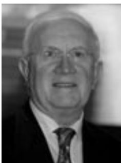
Pat the Cope Gallagher, T.D. Aire Stáit

Síneann sainchúram eacnamúil na Roinne thar chumarsáid, craolachán agus fuinneamh chomh maith le bia mara, iompar muirí, sábháilteacht mhuirí agus acmhainní nádúrtha. Tá rannchur tábhachtach le déanamh ag an Roinn mar stiúrthóir ar fhás eacnamúil inbhuanaithe thar réimse earnálacha éagsúla chun táirgiúlacht a fheabhsú sa gheilleagar agus um rathúlacht, iomaíochas, inbhuaine agus comhtháthú sóisialta.