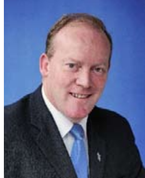
Conchúir Ó Luineacháin, T.D.

Tá an-áthas orm an Tuarascáil Bhliantúil seo ar ghníomhaíochtaí agus éachtaí na Roinne Cumarsáide, Fuinnimh agus Acmhainní Nádúrtha le linn 2006 a chur i láthair.